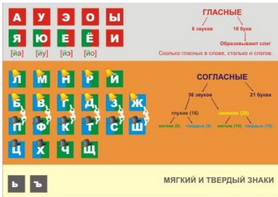
СХЕМА ЗВУКО-БУКВЕННОГО АНАЛИЗА